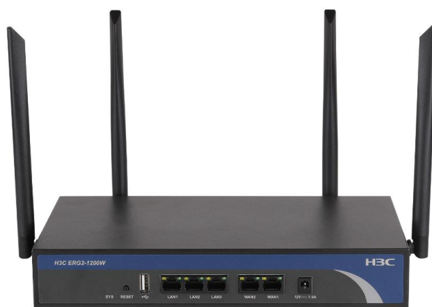
ERG2-1200W 第二代企业级无线路由器

H3C ERG2-1200W 是新华三技术有限公司（简称 H3C）推出的下一代高性能企业级无线路由器，主要面向写字楼、小微企业、办事处以及商铺等商业用户，除了提供高速稳定的上网环境外，还能实现超大面积的无线覆盖，以及满足多用户高密接入需求。在满足中小企业用户基本无线、有线上网需求的同时，并为企业提供专业的稳定可靠的上网环境。