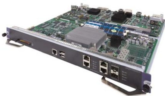
SecBlade NetStream 模块

SecBlade NetStream 模块与基础网络设备融合，具有即插即用、扩展性强的特点，降低了用户管理难度，减少了维护成本。