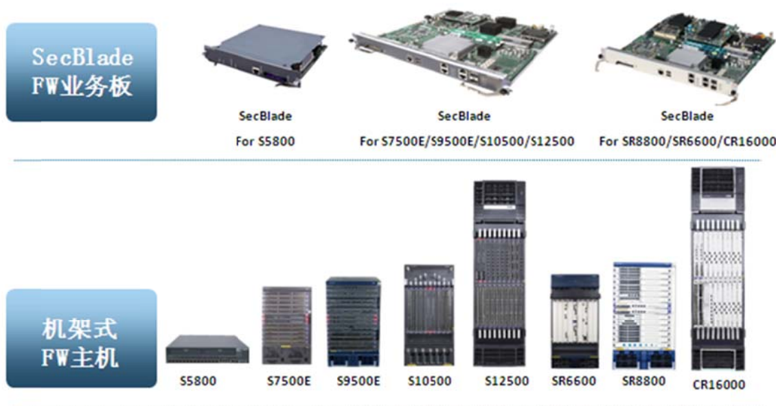
SecBlade FW 模块外观

SecBlade FW 模块与基础网络设备融合，具有即插即用、扩展性强的特点，降低了用户管理难度，减少了维护成本。