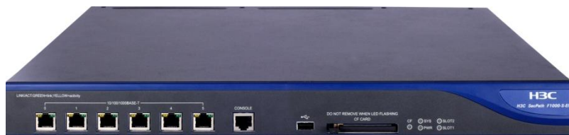
SecPath F1000-S-EI 防火墙产品

SecPath F1000-S-EI 防火墙充分考虑网络应用对高可靠性的要求，业务接口卡支持热插拔，充分满足网络维护、升级、优化的需求；支持双机状态热备，支持 Active/Active 和 Active/Passive 两种工作模式。提供机箱内部环境温度检测功能，支持网管的统一管理。