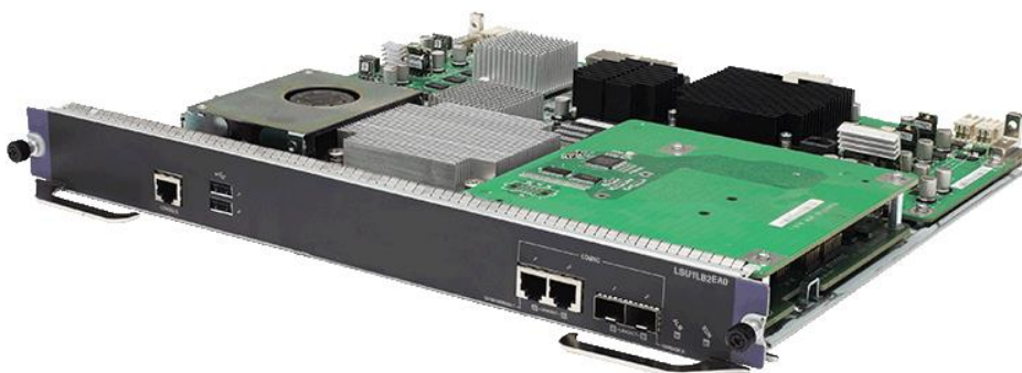
H3C SecBlade ADE 应用交付引擎

通过部署 H3C SecBlade ADE 应用交付引擎，能够大大降低网络的采购成本和运维成本，同时增加了网络的灵活性和可扩展性。