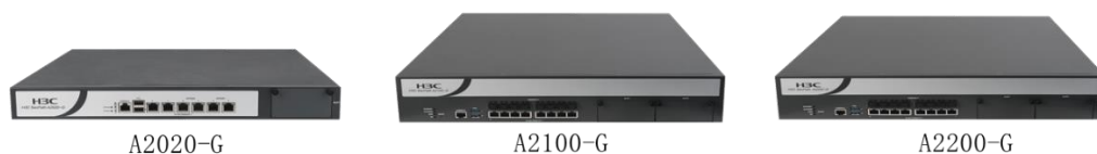
H3C SecPath A2000-G 系列 运维审计系统外观图

H3C SecPath A2000-G 产品广泛适用于“金融、运营商、政府、教育、能源”等各个行业。部署该产品，可以帮助用户解决目前面临的运维管控问题，提高运维效率，规避运维风险。