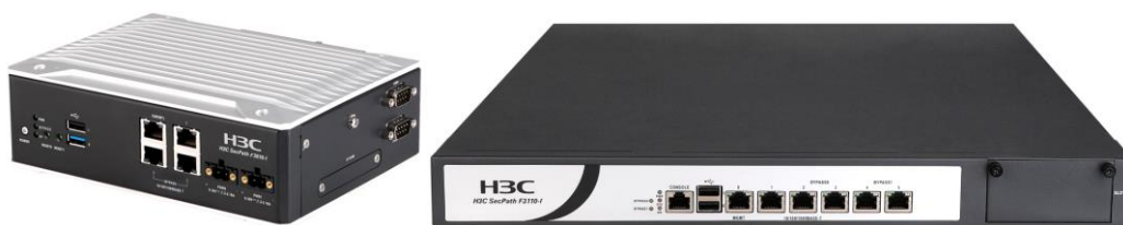
H3C 工控防火墙产品外观图

针对工控网络和系统，H3C 工控防火墙支持针对包括 Modbus/TCP、OPC Classic、OPC UA、DNP3、S7、S7 plus、IEC60870-5-104、MMS、Ethernet/IP 等在内的各类主流工控网络协议的深度解析功能，并在此基础上基于工控网络白名单对工控流量进行智能保护和指令级控制。此外，防火墙通过集成工控漏洞库和工控入侵检测特征库，以工控网络黑名单技术对工控网络中的攻击和入侵行为进行检测和阻断。