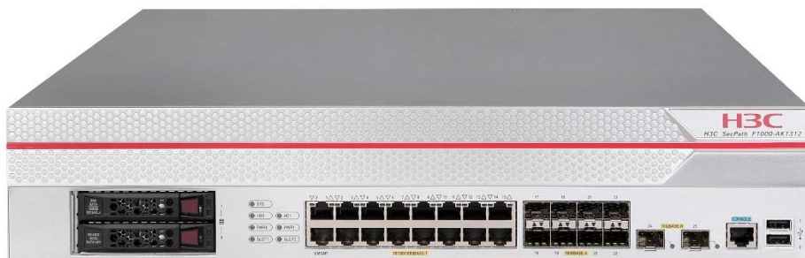
图1-6 SecPath F1000-AK1312/1322/1332 产品外观图