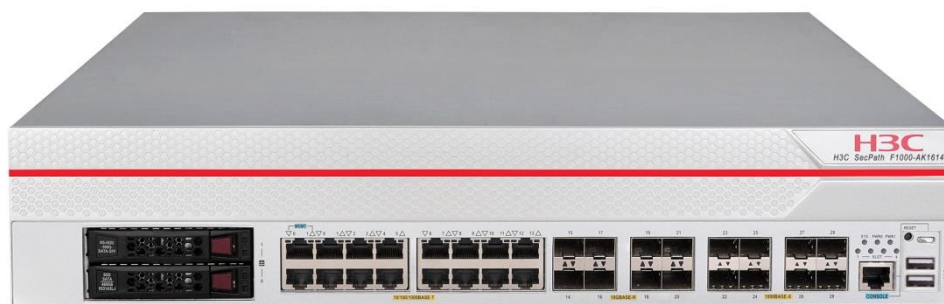
图1-8 SecPath F1000-AK1614 产品外观图