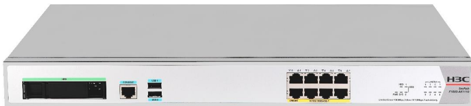
图1-1 SecPath F1000-AK1110 产品外观图

在虚拟化和可靠性方面，基于 H3C 领先的 ComwareV7 平台，支持 2 台设备集群及 1:N 虚拟化。更好地适应云计算的要求的弹性扩展能力。