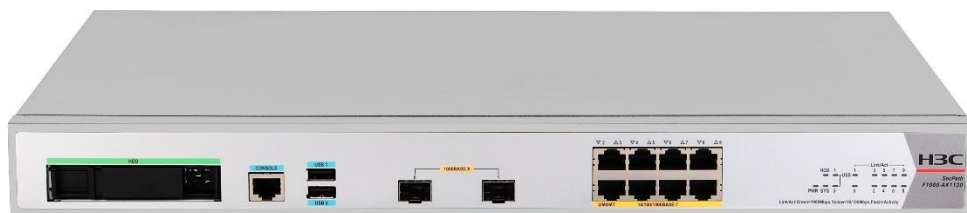
图1-2 SecPath F1000-AK1120 产品外观图