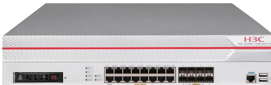
图1-5 SecPath F1000-AK1212/1222/1232 产品外观图