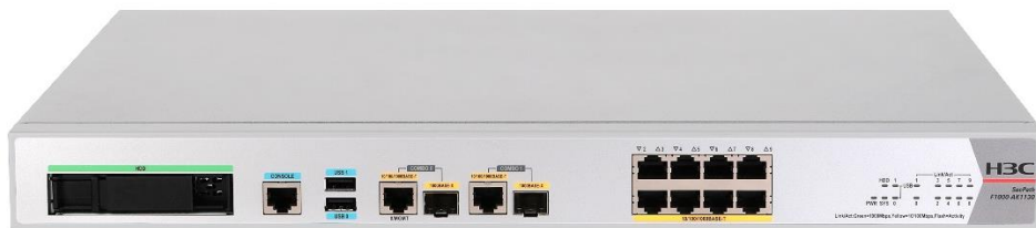
图1-3 SecPath F1000-AK1130 产品外观图