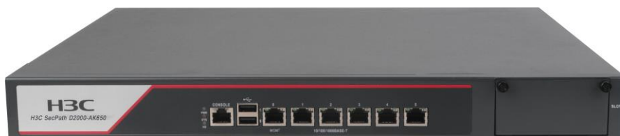
H3C SecPath D2000-AK650

H3C SecPath D2000-AK 系列数据库审计系统广泛适用于“政府、公安、财政、教育、能源、工商、社保、医疗、国土、金融、运营商、企业”等所有涉及数据库应用的各个行业。