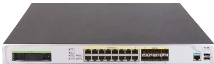
图1-2 SecPath T1060/T1080 产品外观图