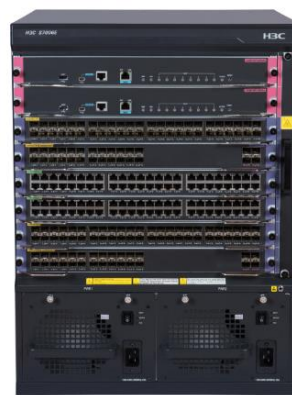
H3C S7006E 高端多业务路由交换机