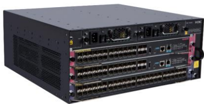
H3C S7003E 高端多业务路由交换机

H3C S7000E 产品是新华三技术有限公司（以下简称 H3C 公司）面向业务网络的高端多业务路由交换机，该产品基于 H3C 自主知识产权的 Comware V7 操作系统，以 IRF2（Intelligent Resilient Framework2，第二代智能弹性架构）为系统基石的虚拟化软件系统，支持 TRILL 和 MDC（一虚多）技术，进一步融合 MPLS VPN、IPv6 等多种网络业务，提供不间断转发、不间断升级、优雅重启、环网保护等多种高可靠技术，在提高用户生产效率的同时，保证了网络最大正常运行时间，从而降低了客户的总拥有成本（TCO）。H3C S7000E 可配备双主控双电源，并且符合“限制电子设备有害物质标准（RoHS）”，是绿色环保的路由交换机。