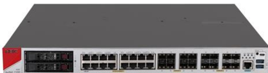
H3C SecPath F1000-AI-60 产品外观图