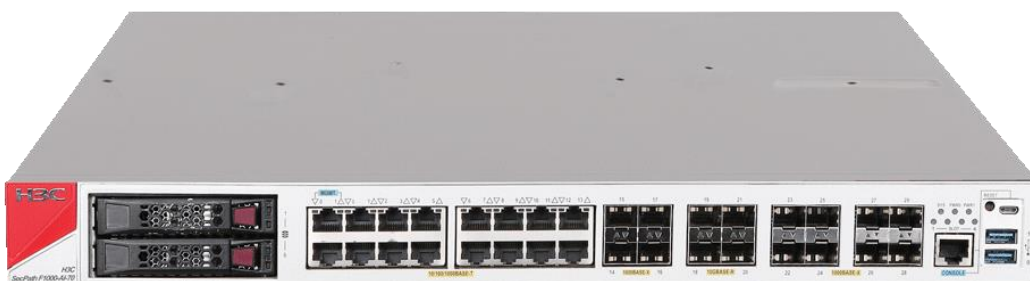
H3C SecPath F1000-AI-70 产品外观图