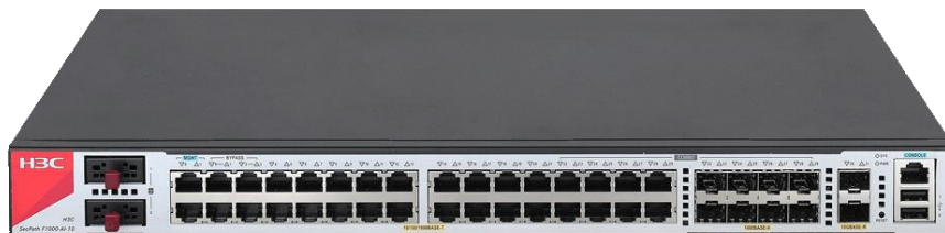
H3C SecPath F1000-AI-10 产品外观图

在虚拟化和可靠性方面，基于 H3C 领先的 ComwareV7 平台，支持多设备集群及 1:N 虚拟化。更好地适应云计算的要求的弹性扩展能力。