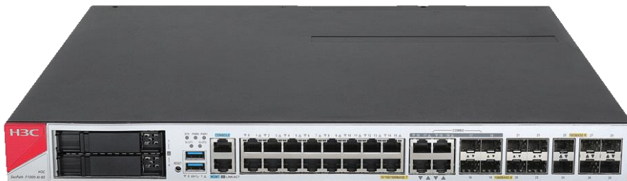
H3C SecPath F1000-AI-65 产品外观图