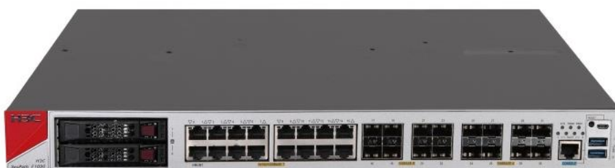
H3C SecPath F1000-AI-90 产品外观图