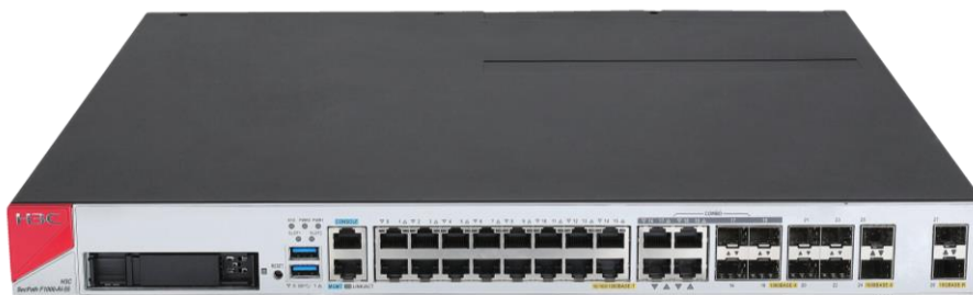
H3C SecPath F1000-AI-55 产品外观图