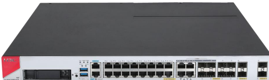
H3C SecPath F1000-AI-25 产品外观图